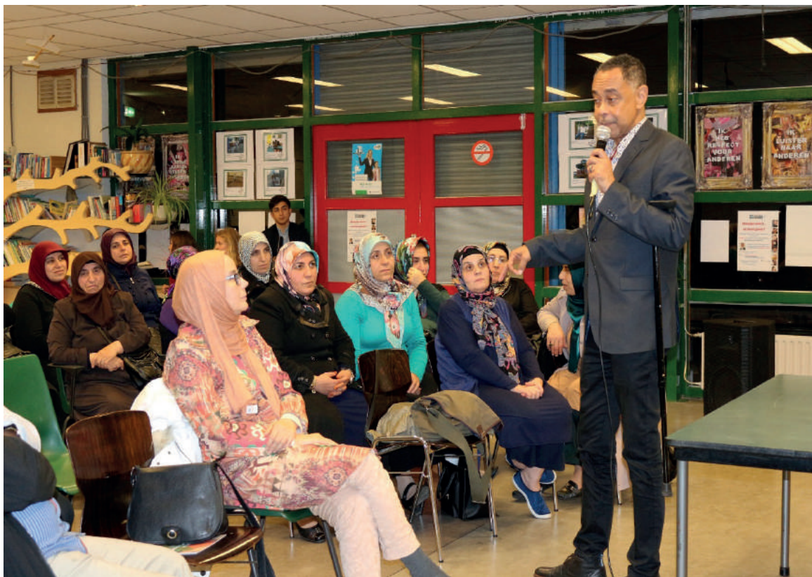
De Wijkacademie heeft regelmatig wijkbijeenkomsten georganiseerd.